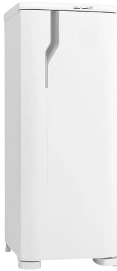
Imagem 2: ilustração da geladeira doméstica.

1.1.1.2. A geladeira doméstica ofertada deverá atender os seguintes requisitos mínimos: