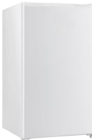
Imagem 3: ilustração do frigobar

1.1.1.3. A geladeira tipo frigobar ofertada deverá atender os seguintes requisitos mínimos: